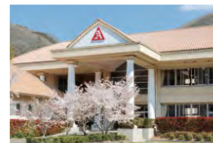
鹿島朝日高等学校

全日制・通信制ともに、鹿島神宮や鹿島アントラーズで知られる茨城県鹿嶋市に本校を構えています。全日制は平成元年に、通信制は平成16年に開設されました。日本全国の卒業生たちが、様々な分野で活躍しています！