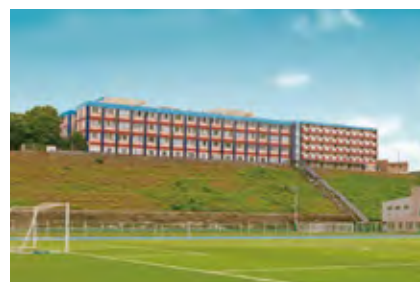
鹿島学園高等学校

全日制・通信制ともに、鹿島神宮や鹿島アントラーズで知られる茨城県鹿嶋市に本校を構えています。全日制は平成元年に、通信制は平成16年に開設されました。日本全国の卒業生たちが、様々な分野で活躍しています！