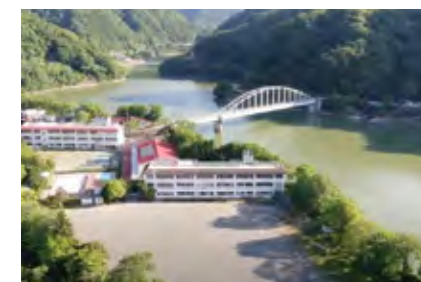
鹿島山北高等学校

岡山県岡山市に本校を構えています。平成28年に、旧通信制の「朝日塾国際高等学校」から「鹿島朝日高等学校」へ校名変更され、鹿島教育グループの一員となりました。現在では、西日本を中心に、全国で多くの生徒から支持を集めています！